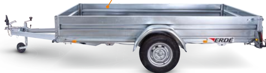
kit ridelles acier galvanisé (hauteur 40 cm)