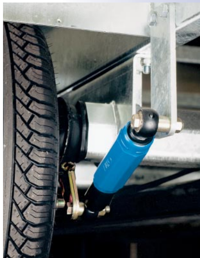
Amortisseur hydraulique (option)

La fixation de la charge sur les remorques s'opère rapidement et en toute sécurité. Des anneaux de fixation pour sangles et autres sont prévus à cet effet sur les côtés. Afin de faciliter les manœuvres d'attelage, de découplage et bien d'autres, toutes nos remorques roues extérieures sont équipées de série d'une roue jockey pivotante sur les modèles freinés et télescopique sur les modèles non freinés. De plus les ridelles en aluminium n'ont pas pour seul avantage d'être légères, elles sont aussi faciles à l'entretien et ont l'avantage de garder leur beauté des années durant.