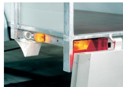
Feux de position visibles ridelle baissée

Une attention particulière est portée à la sécurité chez Ansems Remorques. Ainsi, en plus d'une construction solide nous vous offrons une meilleure visibilité par les autres usagers de la route. Afin d'atteindre cet objectif, nos remorques sont dotées d'un éclairage conforme aux normes européennes en vigueur. Cet équipement est complété et parfait par un éclairage latéral conséquent. Résultat, tous les feux restent visibles ridelles baissées et par tout temps ! Votre remorque restant visible dans la pénombre, vous bénéficiez d'une meilleure sécurité lors d'une utilisation nocturne et par mauvais temps.