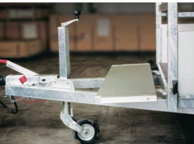
Ridelle en avant ouverte