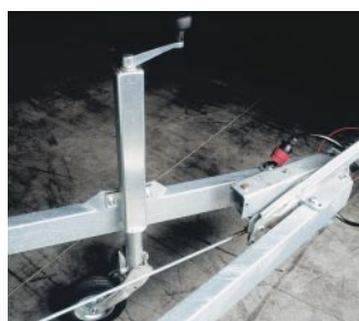
Roue jockey pivotante