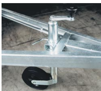
Roue jockey télescopique